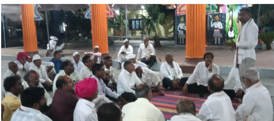
मार्गाने प्रयत्न करीत आहेत, मात्र शासन याची दखल घेत नाही. यासह कोकणचे जे १६८ टीएमसी पाणी येणार आहे, त्यातही बीड जिल्ह्यातील शेतकऱ्यांना हक्काचे पाणी द्यावे, अशी शेतकऱ्यांची मागणी आहे. या

बीड, प्रतिनिधी जायकवाडी धरणाचे हक्काचे पाणी मिळावे यासाठी लोकलढा आंदोलनातील शेतकऱ्यांनी जिल्हाधिकारी कार्यालयावर २९ मे रोजी बैलगाडी मोर्चा काढण्याचा एव्गार पुकारला आहे. या मोर्चात शेतकऱ्यांनी मोठ्या संख्येने सहभागी व्हावे शेतकरी, तरुण गावोगाव बैठका घेत ग्रामीण भाग पिंजून काढत आहेत. शासन नदीजोड प्रकल्पाच्या घोषणा करते, प्रत्यक्षात मात्र हा प्रकल्प कधी होईल, हे सांगता येत नाही. विदर्भात वैगंगा-पैगंगा नदीजोड प्रकल्पाला निधी दिला जातोय, मात्र गोदावरी-सिंदफणा नदीजोड प्रकल्प अद्याप लालफितीत अडकलेला आहे. गोदावरी-सिंदफणा नदीजोड प्रकल्प व श्री क्षेत्र भगवान गड ते तालखेडपर्यंत उपकलवा करावा यासाठी सर्वे करण्याचे पत्र जलसंपदा मंत्री राधाकृष्ण विखे पाटील यांनी संभाजीनगर येथील वरिष्ठ अधिकारी यांना दिले आहे. यासाठी लोकलढा आंदोलनातील शेतकरी लोकशाही