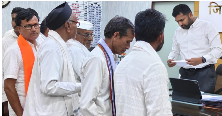
शेतकऱ्यांना सातत्याने दुष्काळाला सामोरे जावे लागते. शेतीला बारमाही पाणी मिळत नसल्याने शेतकरी आत्महत्या, शेतकरी कर्जबाजारीपणा, तरुणांचे स्थलांतर, ऊसतोड मजूर, बेकारी, आरोग्य असे अनेक प्रश्न आहेत. हे प्रश्न सोडविण्यासाठी बीड जिल्ह्यातील शेतीला जायकवाडी धरण व कृष्णा खोऱ्याचे पाणी मिळाले पाहिजे. यासाठी अनेक वर्षांपासून सातत्याने मागणी व आंदोलने होत आहेत. मात्र शासन या योजनांना एक रुपयाही निधी देत नसल्याने शेतकऱ्यांमध्ये संताप आहे. यासाठी शुक्रवारी

बीड । प्रतिनिधी बीड जिल्ह्यातील शेतकऱ्यांच्या पाचविला पुंजलेला दुष्काळ दूर करण्यासाठी व शेतशिवार हिरेवगार करण्यासाठी शेतीला जायकवाडी धरणाचे पाणी मिळणे गरजेचे आहे. गेल्या अनेक वर्षांपासून ही मागणी धगधगत आहे. यासाठी लोकलढा आंदोलनातील शेतकऱ्यांनी जिल्हाधिकारी यांची भेट घेत आंदोलनाची हाक दिली. त्यामुळे जायकवाडी धरणाचा पाणीप्रश्न पुन्हा एकदा पेटला आहे.