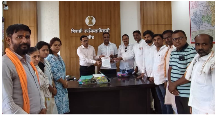
अन्य दिलासा मिळावा या मागण्यांसाठी हा मोर्चा काढण्यात आला होता. मात्र, शांततापूर्ण व संविधानिक मार्गाने आंदोलन करणाऱ्या शेतकरी व नेत्यांवर पोलिसांनी बळाचा वापर

बीड । प्रतिनिधी मुंबई येथे कोकण विभागातील आंबा व काजू उत्पादक शेतकऱ्यांच्या विविध मागण्यांसाठी काढण्यात आलेल्या मोर्चावर पोलिसांनी केलेल्या कारवाईचा निषेध व्यक्त करत बीड जिल्ह्यात शेतकरी कामगार पक्षाच्या वतीने तीव्र प्रतिक्रिया नोंदवण्यात आली आहे. मोर्चादरम्यान प्रमुख नेत्यांना फरफटत नेऊन अटक करण्यात आल्याने लोकशाही मूल्यांवर आघात झाल्याचा आरोप करण्यात आला आहे. या संदर्भात जिल्हाधिकारी यांना देण्यात आलेल्या निवेदनात म्हटले आहे की, कोकणातील शेतकऱ्यांचे आंबा, काजू व इतर फळबागांचे मोठ्या प्रमाणात नुकसान झाले असून त्यासाठी योग्य भरपाई, कर्जमाफी व